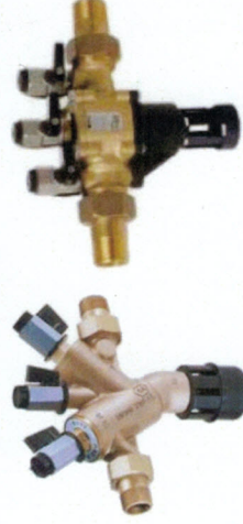
Selvirkende kontraventil Kontrollerbare trykzoner I daglig tale – TBS ventil