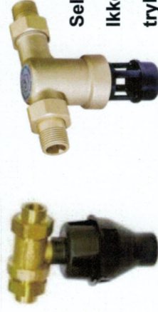
Selvirkende kontraventil Ikke kontrollerbare trykzoner